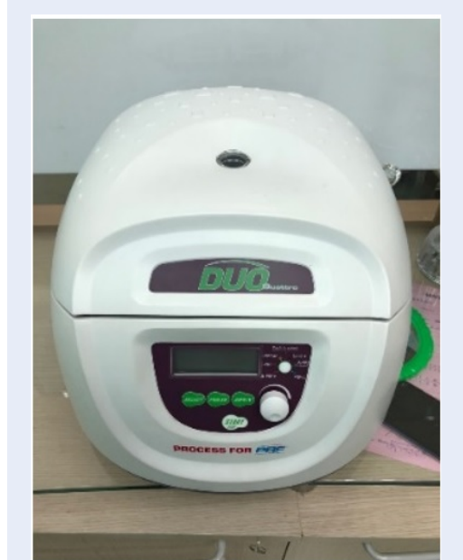
Hình 1: Máy ly tâm Duo Quattro Choukroun PRF system

- Bệnh nhân đủ điều kiện tham gia nghiên cứu được giải thích, thông báo đầy đủ về mục đích nghiên cứu, qui trình phẫu thuật, yêu cầu ghi nhận thông tin, tái khám và ký tên vào mẫu đồng ý tham gia nghiên cứu. Để đảm bảo tính ngẫu nhiên, chúng tôi thực hiện việc ngẫu nhiên theo hàm RAND() trên Microsoft Excel. Thứ tự điều trị được thực hiện bởi bác sĩ cộng tác, sẽ gán ngẫu nhiên trên máy tính (Microsoft Excel 2013) theo từng khối 10 số trước (cho đến khi đủ mẫu nghiên cứu), dùng hàm RAND(), sau đó lệnh sort, tạo ngẫu nhiên thứ tự, đưa vào phong bì dán kín. Sau đó, đánh số bên ngoài phong bì, và tương ứng tạo các phiếu rút số ngẫu nhiên cho bệnh nhân đồng ý với từng số theo khối 10