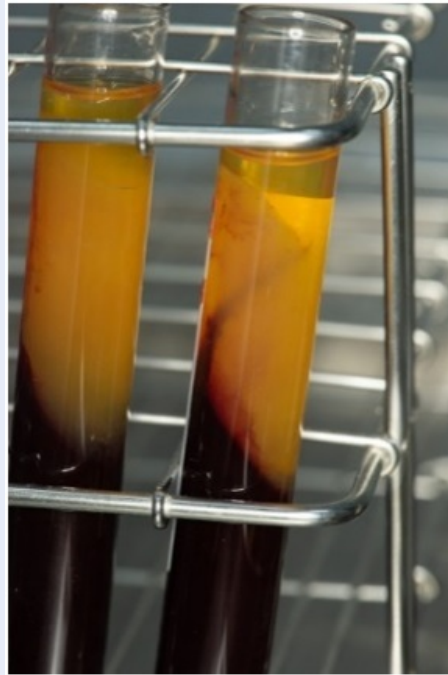
Hình 2: Khối PRF sau khi được chuẩn bị

Đối với nhóm chứng: bệnh nhân được nhổ răng theo quy trình chuẩn thông thường, không đặt A-PRF+. Khâu đóng vết thương bằng chỉ silk (3-0) ở cả hai nhóm.