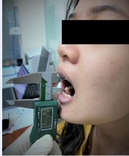
Hình 5: Đo độ há miệng tối đa bằng thước kẹp

Tất cả các biến số liên tục được kiểm định phân phối chuẩn và trình bày dưới dạng trung bình và độ lệch chuẩn hoặc trung vị và khoảng tứ phân vị với phân bố không chuẩn.